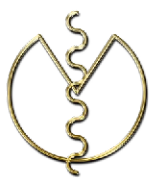
MOHA'RA reine Gedanken