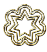
SOL'A'VANA Atem Gottes